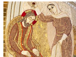
Een van de mozaïeken in de prachtige kerk die bij het klooster hoort