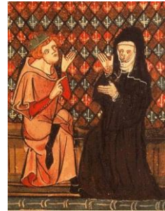
Abélard en Héloïse

In de kring rond Hieronymus, de vertaler van de Vulgaat, noemde hij vrouwen inderdaad tweede keus omdat mannen niet wilden luisteren. Maar vrouwen als Marcella leerden Hebreeuws, ondersteunden zijn vertaalproject en voerden theologische discussies met hem. In de middeleeuwen werd de abdis Héloïse, bekend vanwege haar relatie met Abélard, geïnspireerd door deze vriendinnenkring rond Hieronymus. Zij en de zusters in haar klooster bestudeerden ook de talen van de Bijbel. Ze was van mening dat de Regel van Benedictus haar nonnen niet paste en daarom werd voor haar gemeenschap een nieuwe regel ontworpen.