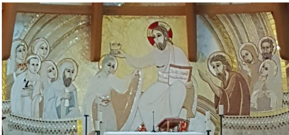
Jezus kroont Maria tussen leerlingen uit alle tijden. Mozaïek in de kerk van het klooster

Dan spreekt ze over de kenmerken van het discipelschap in het Nieuwe Testament. Jezus riep de twaalf leerlingen die we kennen; zij waren amateurs, geen officiële religieuze leiders zoals rabbi's, en hun kring breidde zich al uit ten tijde van Jezus' leven. Vrouwen konden duidelijk ook een volgeling zijn en de diversiteit van mensen, van diensten en taken was erkend. En leeringschap gaat over zowel onderwijzen als onderwezen worden: 'Constant moet de bereidheid zijn om te veranderen, te leren en zich te ontwikkelen onder de leiding van Gods woord.' De bron van het leren is de Bijbel.