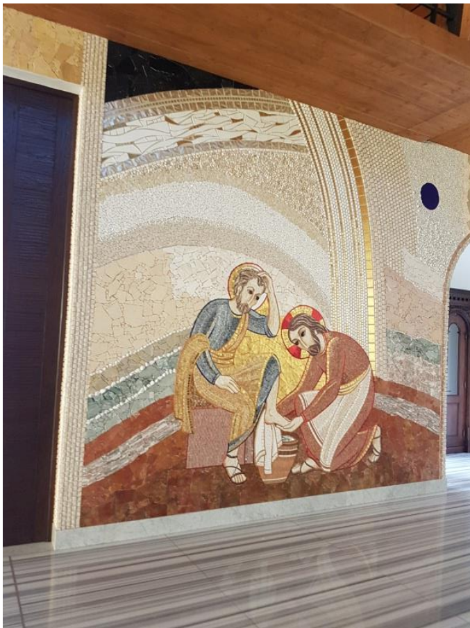
De voetwassing, mozaïek in de kerk van het klooster