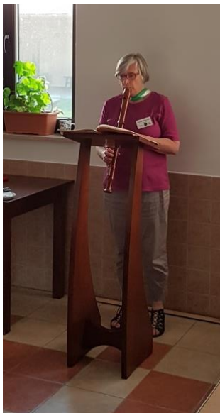
De markt had ook een straatmuzikante

Voor elk land of elke groep was tijdens de markt een tafel beschikbaar om daar hun souvenirs te verkopen, of iets dat vrouwen zelf hadden gemaakt. De opbrengst is naar een project voor de vrouwen van Roemenië gegaan. Samen is zo € 365 bijeengebracht. Iedereen was tevreden, met wat we voor Roemenië hebben gekregen.