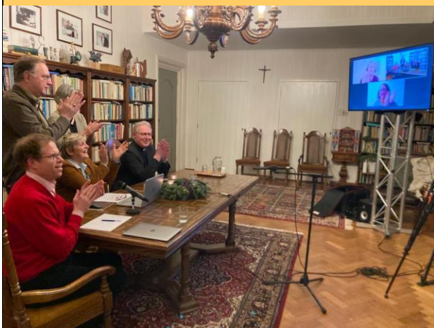
Applaus bij het einde van de webinar