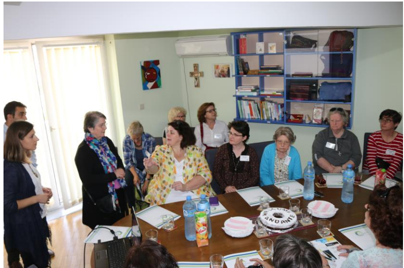
Op bezoek in het kantoor van WML in Tirana

MWL. De jonge stafleden die zo professioneel hun werk presenteren, komen uit achterstandssituaties en hebben onvoorstelbaar