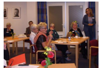
Een betrokken publiek

Gelovige mensen kunnen zich inzetten om te luisteren – naar het gefluister aan de rand. Ze kunnen vragen blijven stellen over medische ontwikkelingen, over de waarden en prioriteiten van de samenleving, over de verantwoordelijkheid van mensen. Het mag zichtbaar zijn dat deze houding gedragen wordt door het bewustzijn dat God anders kijkt dan ‘de wereld’.