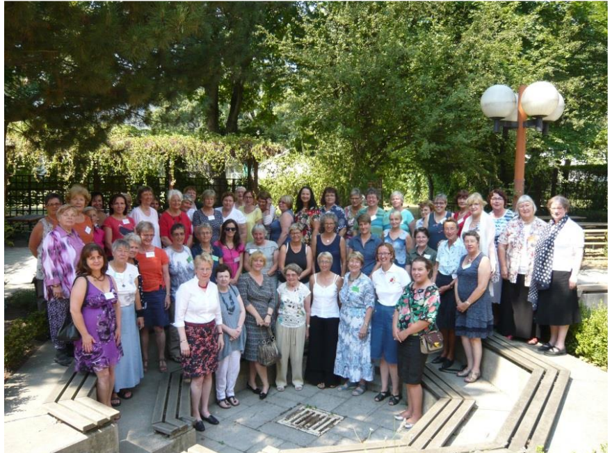
Summer School in Wenen