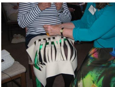
Samen weven en praten

Na elke uiteenzetting is er tijd voor overleg. Deze nabeschuiving gebeurt aan de hand van vragen in 8 vaste groepjes, ingedeeld naar taal.