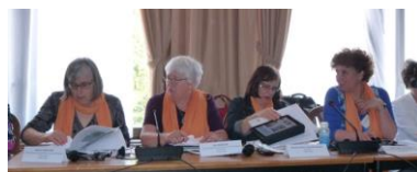
In de statutaire vergadering

Nog voor de lunch komen de nationale organisaties samen om te bespreken welke thema’s voor hen van belang zijn. De Nederlandse delegatie koos voor strijd tegen mensenhandel en verantwoordelijkheid voor de schepping.