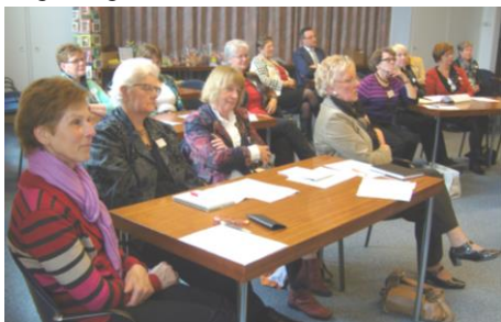
Meer vrijheid voor debat