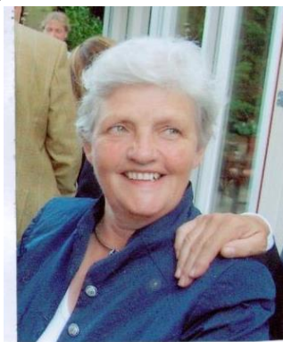
Dat probeer ik uit te dragen

(Ineens heel aarzelend) 'Ik denk... ik heb er geen zicht op... dat we moeten proberen de Unie NKV niet te verenigen tot de mensen die lid zijn van een vrouwenorganisatie... De vraag blijft voor mij wel of de vorm beter aangepast kan worden aan de behoeftes, inzichten van deze tijd. Belangrijk is dat de boodschap van de Unie wordt uitgedragen; die boodschap is nog steeds actueel!'