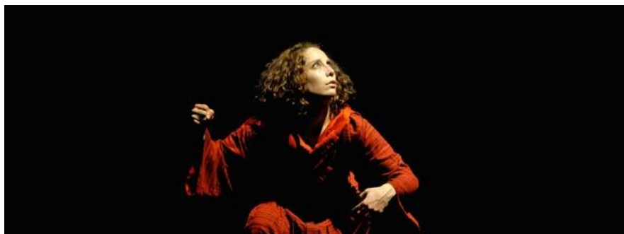
Twijfel en verlangen (Juste Ciel, choreografie van Nicole Mossoux)

Aanmelding en informatie: info@unienkv.nl of (0475) 488 790.