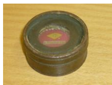
Relikwie en akte van S. Hiacintus. 1837

Naast de meer administratieve documenten als notulen, jaarverslagen en begrotingen, die we ook bij andere vrouwenorganisaties tegenkomen, trof ik toneelstukken, protesten tegen de uitdrijving van Spaanse Jezuiten en zelfs een relikwie met akte van Sint Hiacintus aan. En laten we de statige groepsfoto's, de vaandels en de speldjes vooral ook niet vergeten.